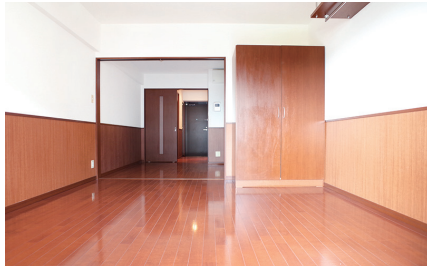
※反転タイプあります。※実際と異なる場合は現況を優先いたします。