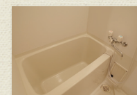
浴室乾燥機付ユニットバス