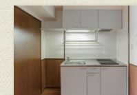
2口IHコンロ付キッチン