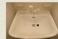
シャンプードレッサー