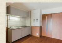
ダイニングキッチン2