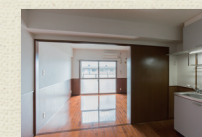
ダイニングキッチン1