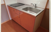
2口IHコンロ付キッチン