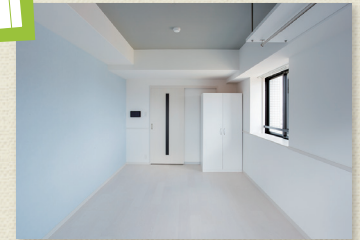
アクセントウォールがお洒落な居室