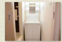
シャンプードレッサー