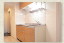
2口IHコンロ付キッチン