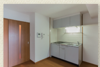
ダイニングキッチンスペース