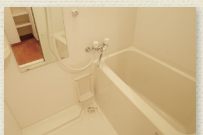
浴室乾燥機付ユニットバス