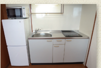
2口IHコンロ付キッチン