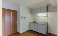
ダイニングキッチンスペース