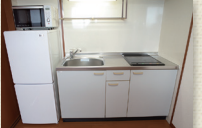
2口IHコンロ付キッチン