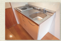
2口IHコンロ付キッチン