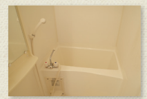
浴室乾燥機付ユニットバス