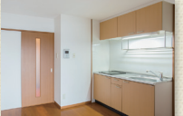
2口IHコンロ付キッチン