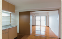
キッチンスペース (1DK)