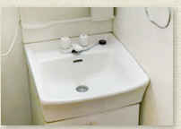
独立洗面台(Aタイプ)