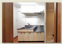
グリル付2口ガスコンロキッチン