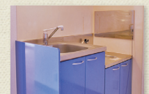
キッチン(ガスコンロ持込)