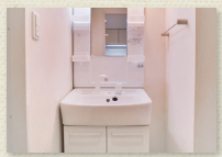
シャンプードレッサー