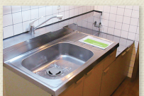
コンロ持込キッチン