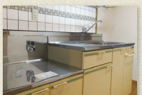
コンロ持込キッチン