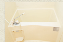
浴室乾燥機付ユニットバス