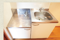
ガスコンロ持込キッチン