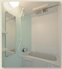
浴室乾燥機付ユニットバス