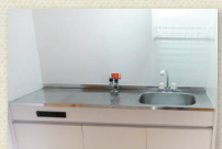
ガスコンロ持込キッチン