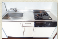
2口ガスコンロキッチン