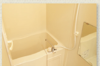
浴室乾燥機付ユニットバス