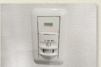
人感センサー付ライト