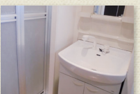
シャンプードレッサー