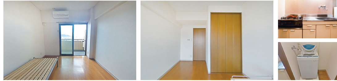
※ベッドは付きません。