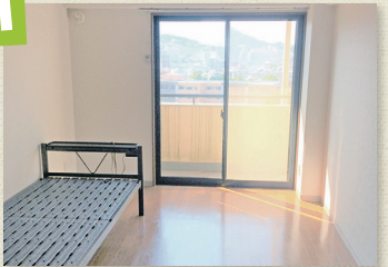
居室(ベッドは付きません)