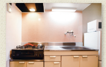
グリル付2口ガスコンロキッチン