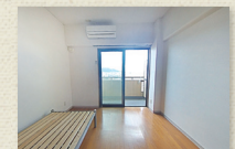
居室(ベッドは付きません)