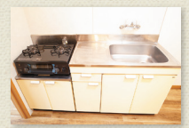
グリル付2口ガスコンロキッチン