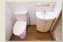
独立洗面台/洗浄付便座